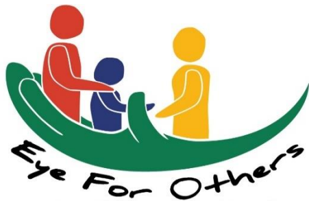
Eye For Others Netherlands