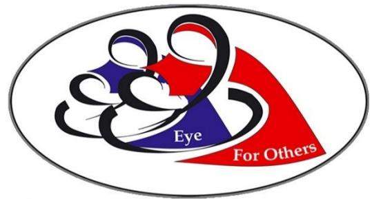
Eye For Others South Africa